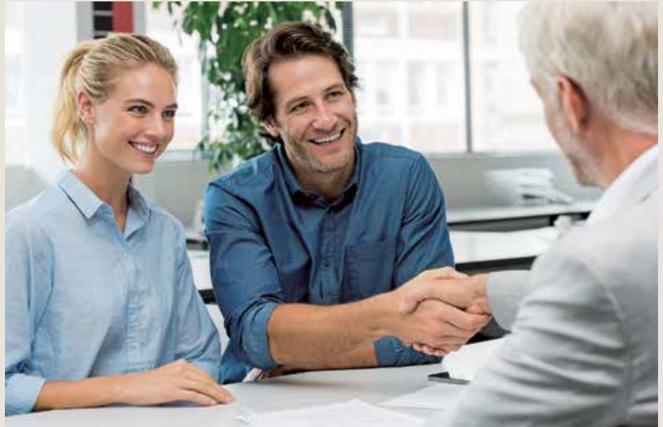
Anschlussfinanzierung Bauherren sollten hier rechtzeitig das Gespräch suchen

Anschlussfinanzierung All diese Themen sind für Hausbesitzer von großer Bedeutung. Vor allem die Anschlussfinanzierung in Zeiten steigender Zinsen macht Kunden Angst. Gerade hier lohnt sich