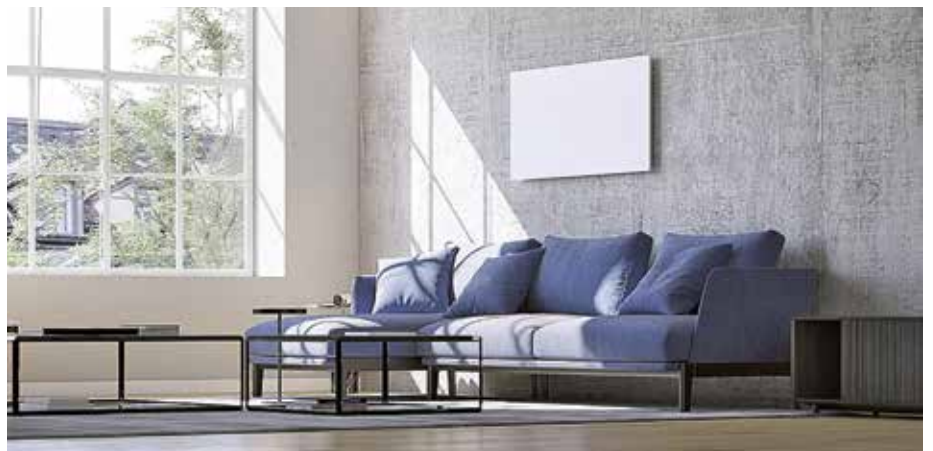
Wandheizung Dimplex IRM Infrarot-Metallheizung gibt es mit 320, 650, 800 oder 1000 Watt Leistung

Fazit Ob sich mit einer elektrischen Heizung in jedem Fall sparen lässt, darf bezweifelt werden. Bleibt der Trost, in Zukunft Strom aus Wind-, Wasserkraft oder Sonnenenergie zu nutzen. ■